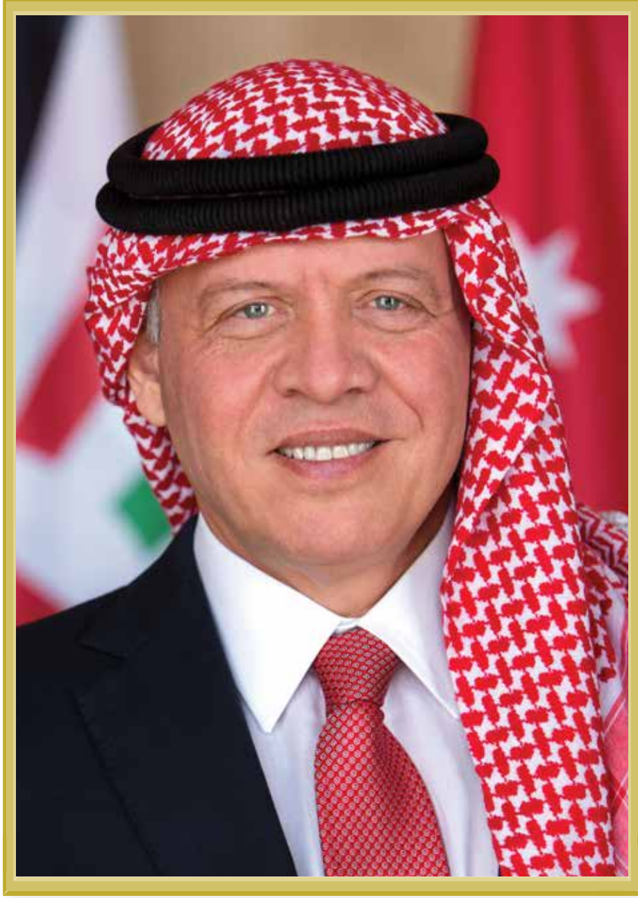
حضرة صاحب الجلالة الملك عبدالله الثاني ابن الحسين المعظم