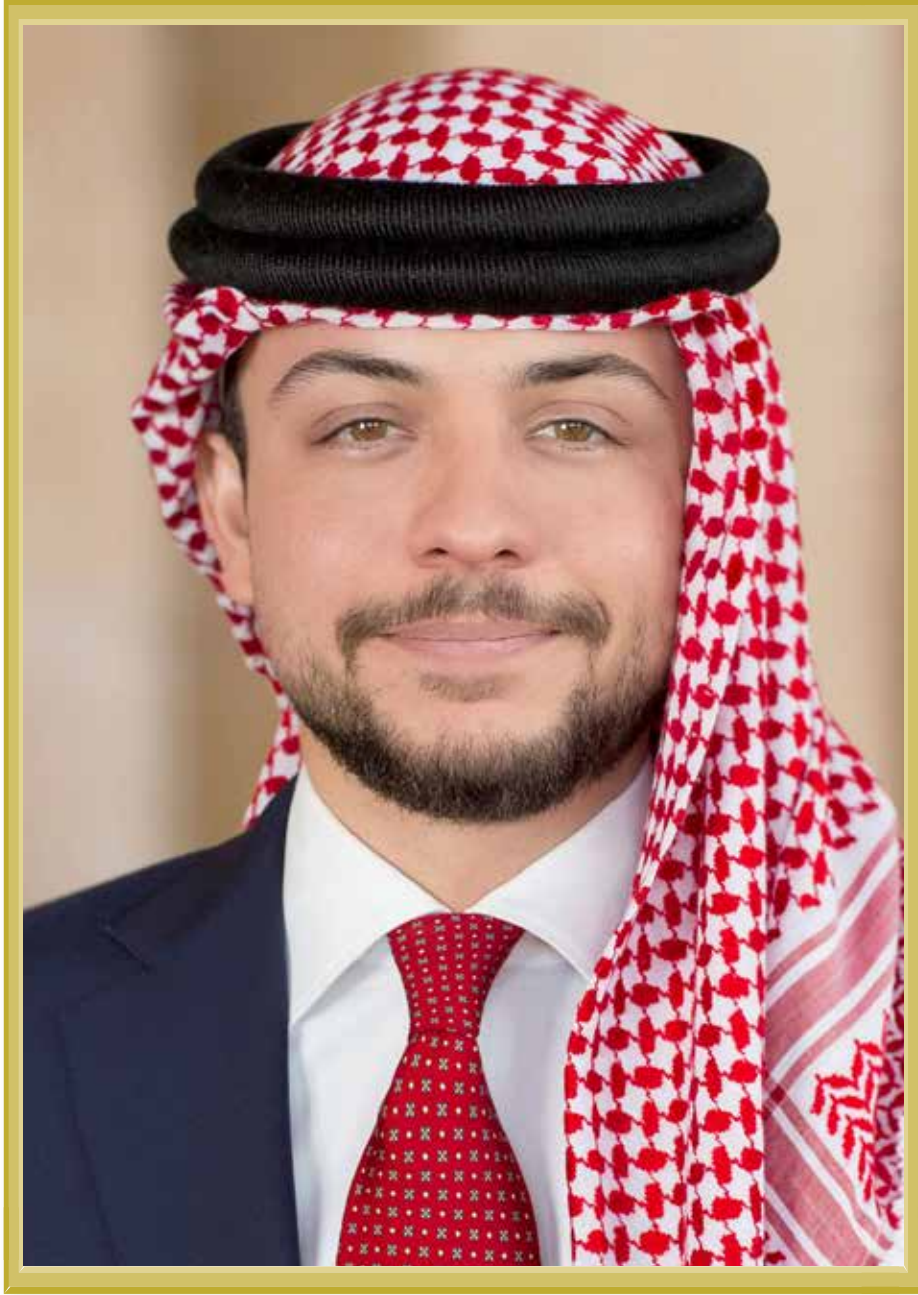
ولي العهد الأمير حسين ابن عبدالله الثاني